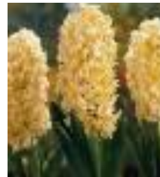
City of Haarlem