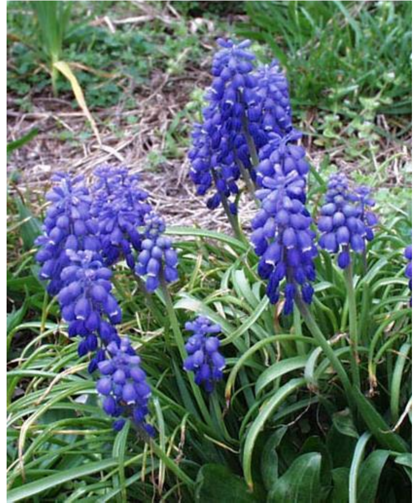
bloeitijd april - mei, hoogte 10 - 20 cm