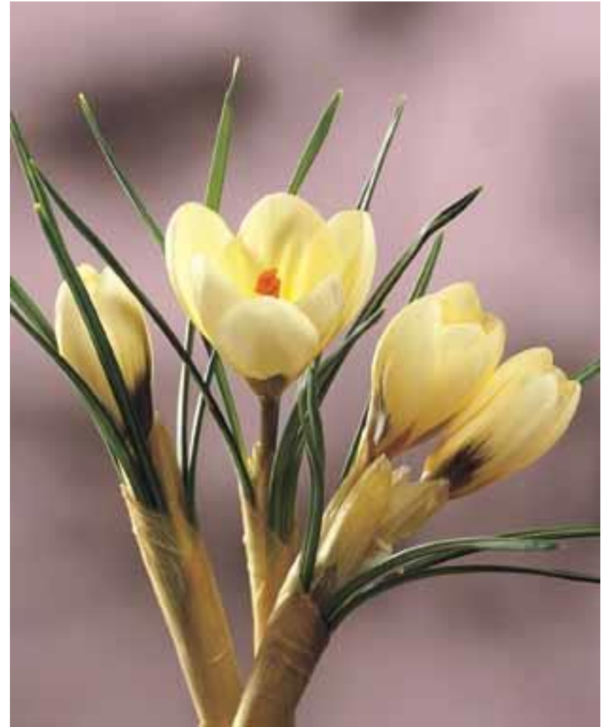
bloeitijd februari - maart, hoogte ca.10 cm